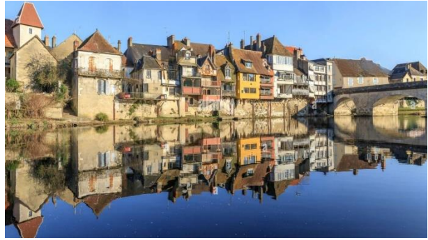
Argenton s/ Creuse